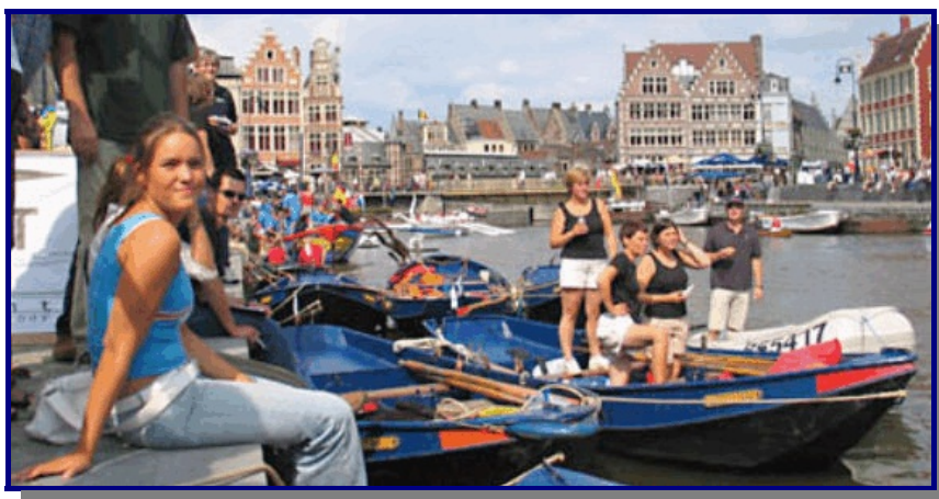
Schlag om Gent

intérieures de Gand au port des yachts. Dans le soir il y avait une réception et une présentation des prix.