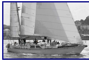
Lord Rank

Les Courses des Petits Voiliers ont commencé dans 2002, organisé par "the Association of Sail Training Organisations" (ASTO) du