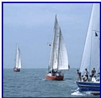
Small Ships Race

The "Small Ships" Races started in 2002, organized by the Association of Sail Training Organizations (ASTO). Some people in sail training circles in